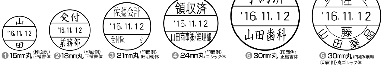
1 15mm丸 (印面例) 正楷書体 2 18mm丸 (印面例) 正楷書体 3 21mm丸 (印面例) 細明朝体 4 24mm丸 (印面例) ゴシック体 5 30mm丸 (印面例) 正楷書体 6 30mm丸 (内組み専用) (印面例) 丸ゴシック体