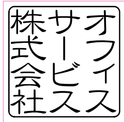
45 印面サイズ / 30×30mm (印面例) 隷書体 角丸