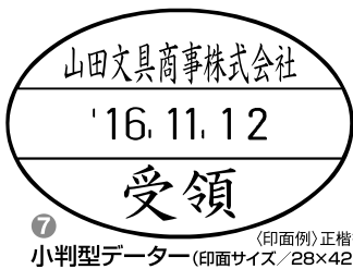
7 小判型データー (印面サイズ/28×42mm) (印面例) 正楷書体